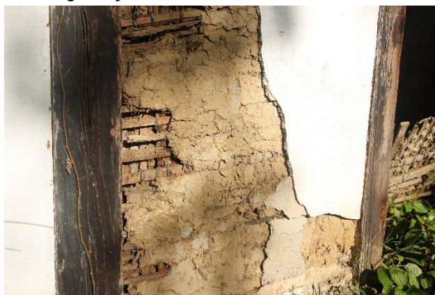
Figura 5. Fotografia do tsuchikabe encontrado na Residência Fukasawa, 2023. Todas as camadas visíveis, devido ao estado de degradação.