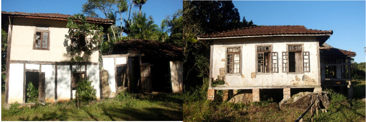
Figura 3. Fotografias das Residências Fukazawa e Hokugawa, da esquerda para direita. Estado de conservação deteriorado de ambas.