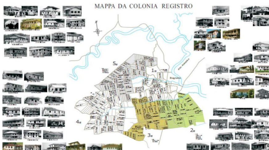
Figura 1. Mapa da Colônia de Registro, com todas as casas identificadas por Hijioka, confeccionado com base no Álbum das Colônias.

Fonte: Akemi Hijioka, 2016, p. 84. Hijioka, A. e Yoneda, S. 2013