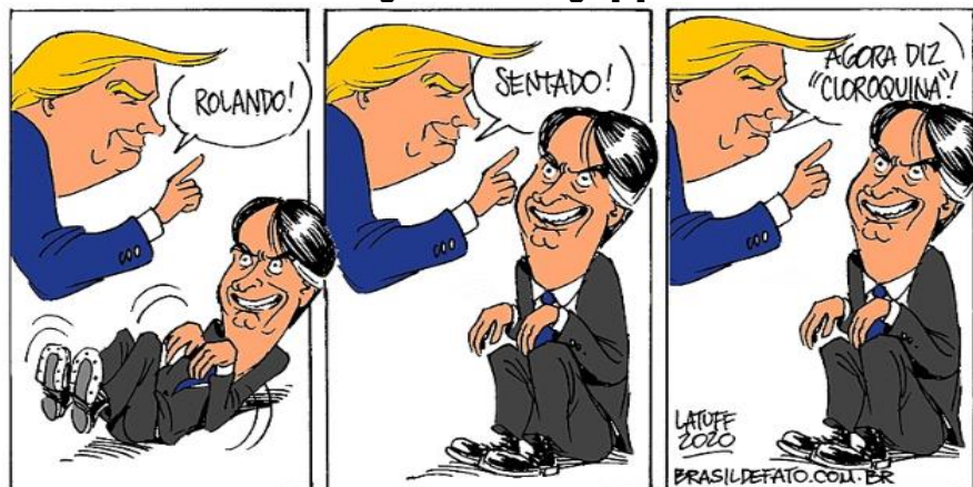
Figura 7 – Charge [7]

LATUFF, Carlos. Brasil de Fato, 22 mai. 2020.