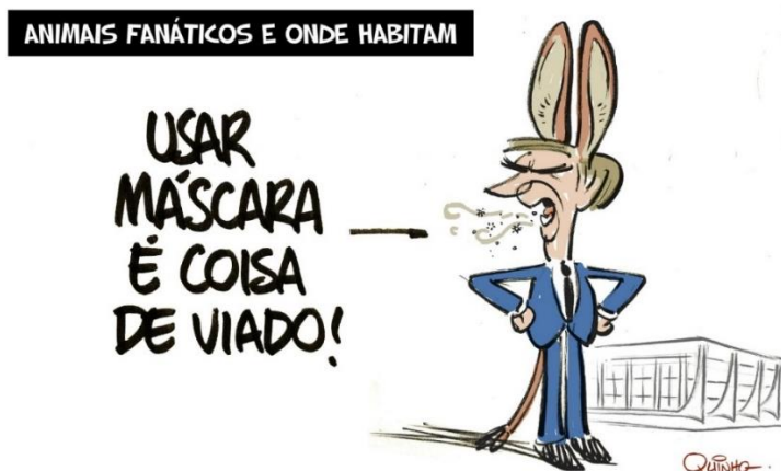
Figura 3 – Charge [3]

Fonte: QUINHO. Estado de Minas, 9 jul. 2020.