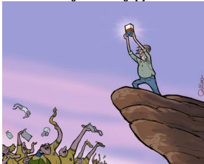
Figura 6 – Charge [6]