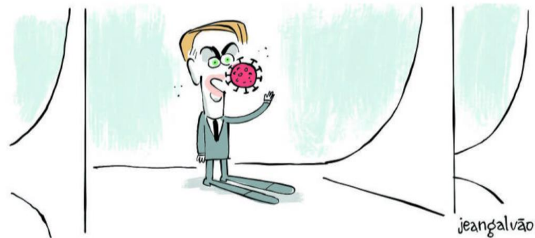
Figura 1 – Charge

Fonte: GALVÃO, Jean. Folha S. Paulo, 29 mar. 2020.