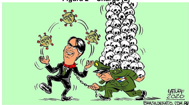
Figura 2 – Charge [2]

Fonte: LATUFF, Carlos. Brasil de Fato, 18 jul. 2020.