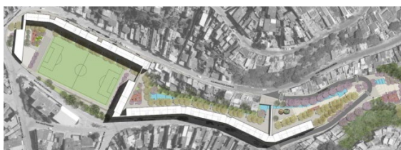
Figura 4 - Implantação Parque Novo Santo Amaro V.

A partir da implantação presente na figura 4, é possível notar também a intenção de dispor as áreas verdes e de lazer no miolo ao longo de toda a extensão da gleba com um percurso interno e acessível à população do entorno, de modo a criar diferentes espaços e usos coletivos que ofereçam alternativas de lazer e possibilitem o uso da comunidade.