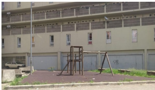
Figura 5 - Térreo originalmente livre que foi fechado com portões para abrigar vagas de estacionamento.

Ademais, o espelho d'água – frequentemente citado por Vignasca como elemento importante do partido usado como solução para canalização do córrego – encontra-se aparentemente sem manutenção e parte dos espaços livres são usados como estacionamentos para carros. Os vãos livres presentes em parte do térreo foram fechados, gradeados e os bancos retirados também com o objetivo de abrigar vagas de estacionamento, conforme é apresentado na figura 5. O gradeamento dos espaços de acesso à circulação vertical contribuiu para a formação de pequenos pátios privados usados como local de encontro e permanência entre os moradores. O principal acesso aos espaços coletivos pela Rua Francisco Queiróz é a escadaria. Além de dar acesso aos espaços coletivos, a entrada próxima à escadaria também dá acesso aos corredores-varanda que conectam as ruas de diferentes níveis. O acesso à escadaria foi gradeado, mas permanece com os portões abertos. A escadaria possui acúmulo de entulho, cheiro de urina e de acordo com moradores, é ponto de encontro de entre jovens que frequentam bailes nas ruas do entorno aos fins de semana.