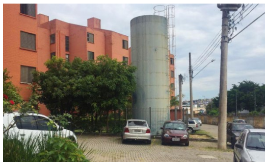
Figura 3 - Estacionamento do conjunto Copromo.

As vagas de estacionamento foram demarcadas a fim de atender a legislação vigente na época, que previa uma vaga de estacionamento para cada três unidades habitacionais. As vagas são compartilhadas pelos moradores, que não podem determinar donos aos espaços e não são permitidas coberturas nos estacionamentos. Nota-se que muitos moradores estacionam os carros nas ruas internas próximas ao espaço de lazer no centro da gleba, pois optam em deixar os carros mais próximos das unidades habitacionais, onde podem vigiar. Há vagas que foram delimitadas pela prefeitura nas bordas da gleba, porém são menos utilizadas por estarem distantes das torres habitacionais. A figura 3 apresenta uma das conformações de bolsão de estacionamento presente no conjunto.