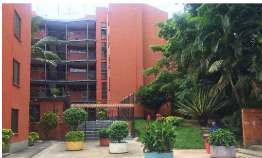
Figura 2 - Recinto e acesso gradeado de uma das torres habitacionais do Copromo.

Atualmente o conjunto habitacional possui duas portarias, que só permitem o acesso de moradores. Houve também o início de um processo de gradeamento da entrada das torres habitacionais, como pode ser observado na figura 2. Apenas duas torres não possuem portões.